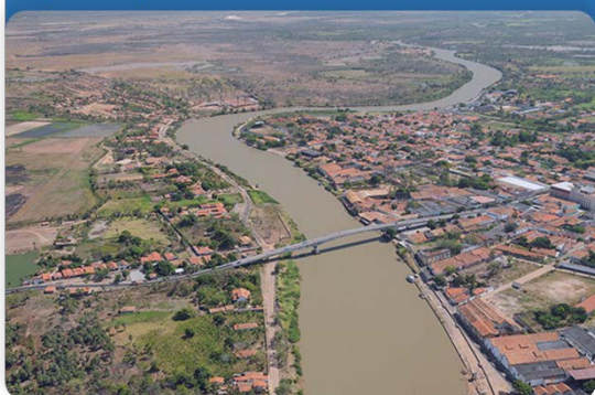
Eixo Temático 2

Regulação de Usos e operação de reservatórios