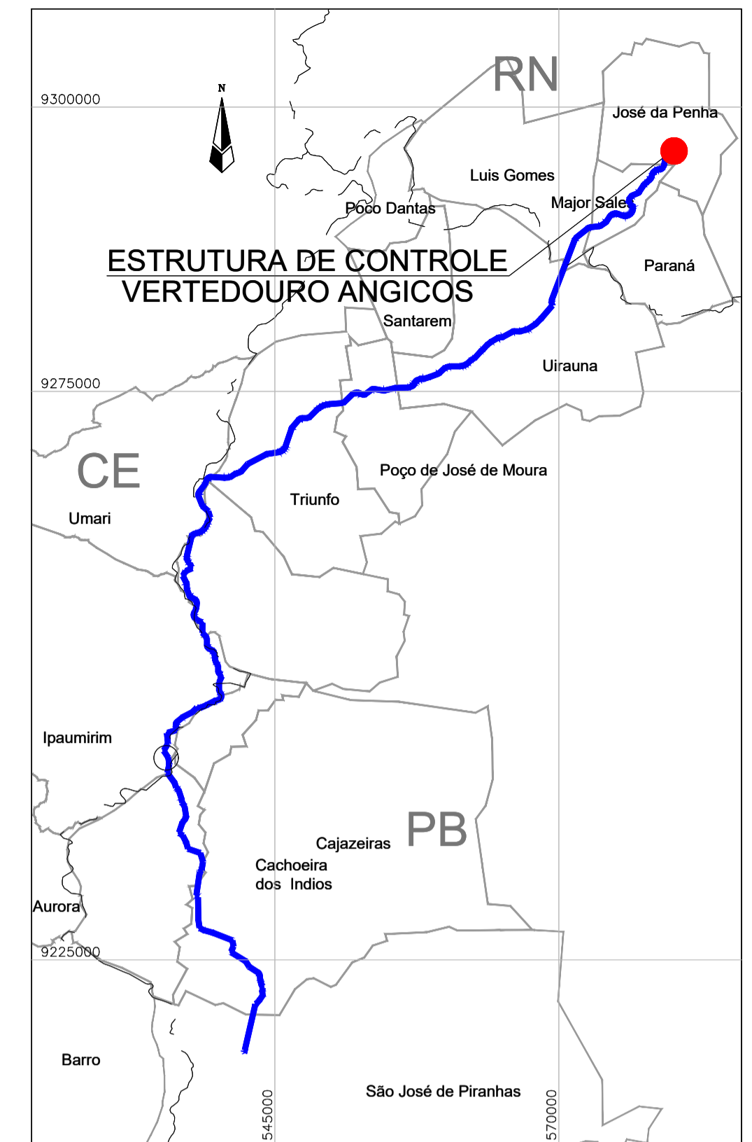
PLANTA DE SITUAÇÃO ESCALA: S1E