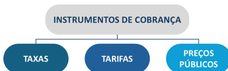
Figura 2 – Instrumentos de cobrança previstos na Lei nº 11.445/2007

Assim, os instrumentos de cobrança previstos pela Lei para os serviços de saneamento básico, são taxas, tarifas e outros preços públicos (Figura 2).