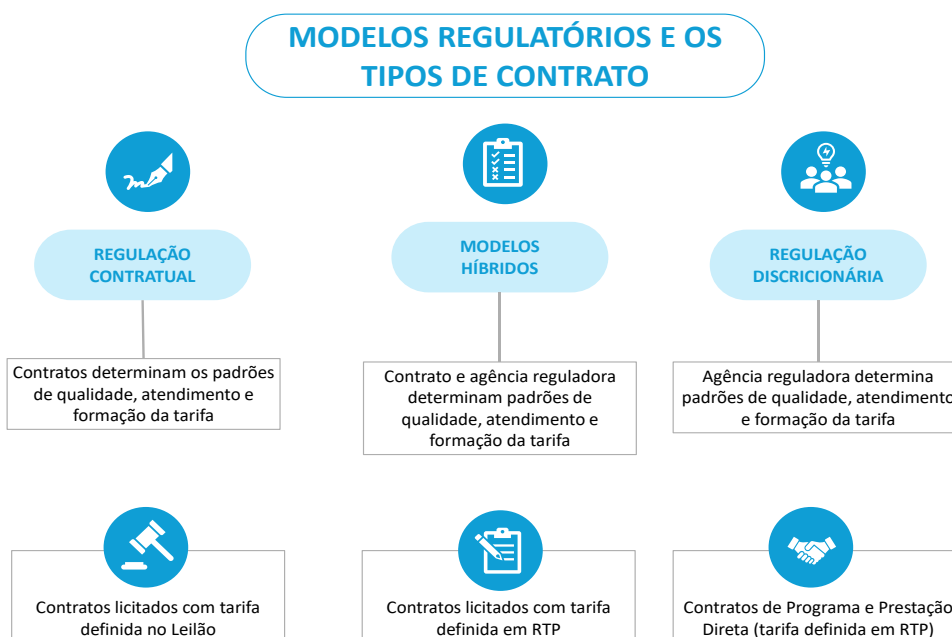
Figura 4 – Modelos Regulatórios

Há ainda a possibilidade de modelos híbridos , nos quais a contratação é precedida de licitação, as regras podem ser definidas em contrato ou regulamentos da entidade reguladora, mas a formação da tarifa não se baseia em um modelo econômico-financeiro de referência definido no momento da licitação, sendo recalculada periodicamente por meio de revisões tarifárias periódicas. Nesses casos, embora a concessão seja formalizada em um processo competitivo,