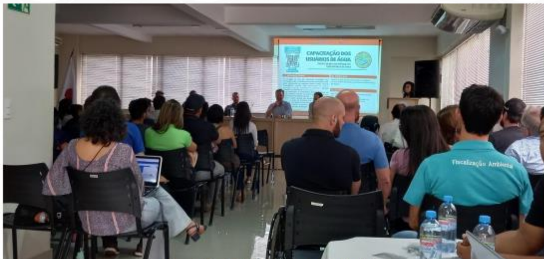
Figura 3.7 - Fala de abertura em Unai/MG.