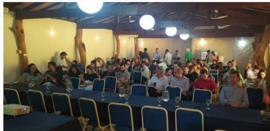
Figura 3.2 - Salão de Convenções do Hotel Catavento em Cristalina/GO.