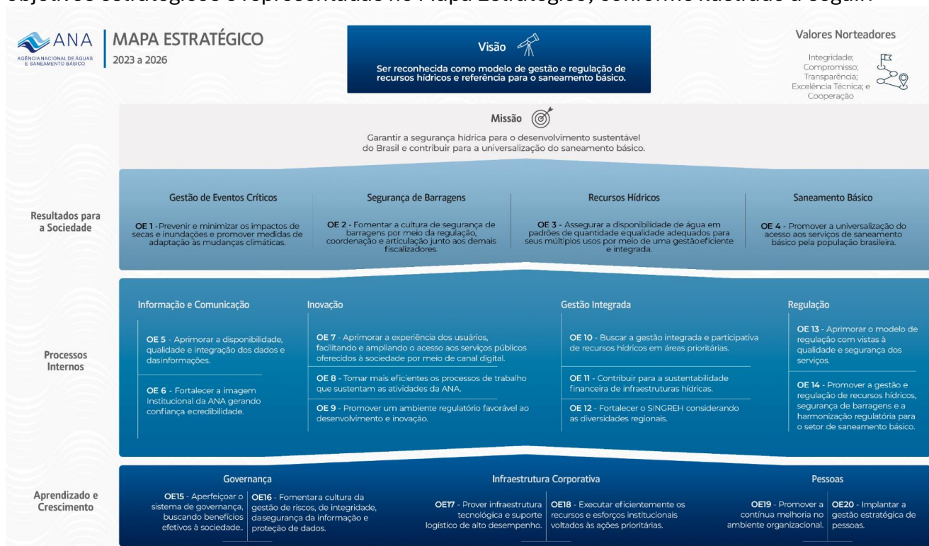
Figura 1: Mapa Estratégico da ANA 2023 – 2026

As prioridades estratégicas da Agência para o período 2023-2026 são descritas em 20 (vinte) objetivos estratégicos e representadas no Mapa Estratégico, conforme ilustrado a seguir.