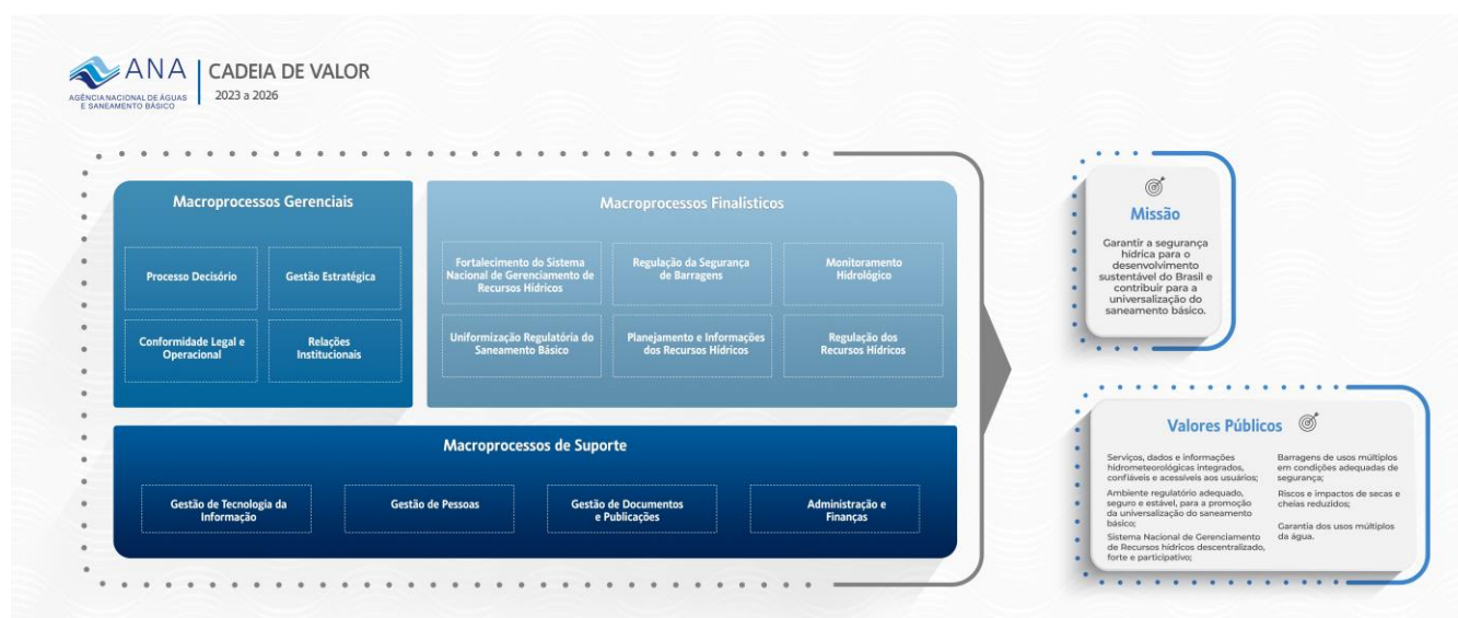
Figura 2: Cadeira de Valor da ANA 2023 – 2026

Ao contemplar desde atividades essenciais de gestão estratégica, conformidade legal e tecnológica, até processos finalísticos como a regulação de barragens, monitoramento hidrológico e fortalecimento do Sistema Nacional de Gerenciamento de Recursos Hídricos, a Cadeia de Valor reforça a conexão entre as operações internas e os Objetivos Estratégicos, garantindo que as ações da Agência sejam orientadas por integridade, eficiência e compromisso com a sociedade.