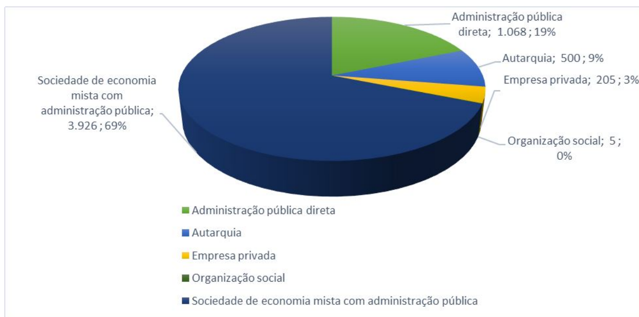
Figura 1: Divisão dos contratos conforme o tipo de prestador do serviço de Saneamento Básico.