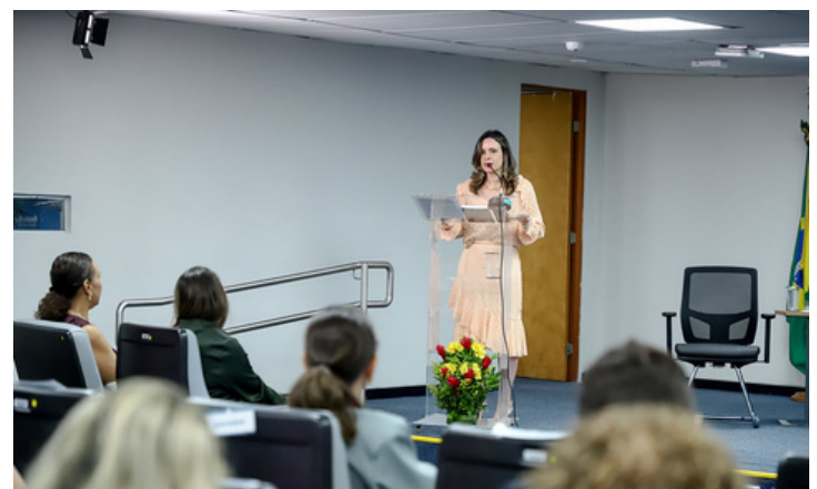
AGU COM ELAS - TODOS POR TODAS NO ENFRENTAMENTO À VIOLÊNCIA CONTRA AS MULHERES