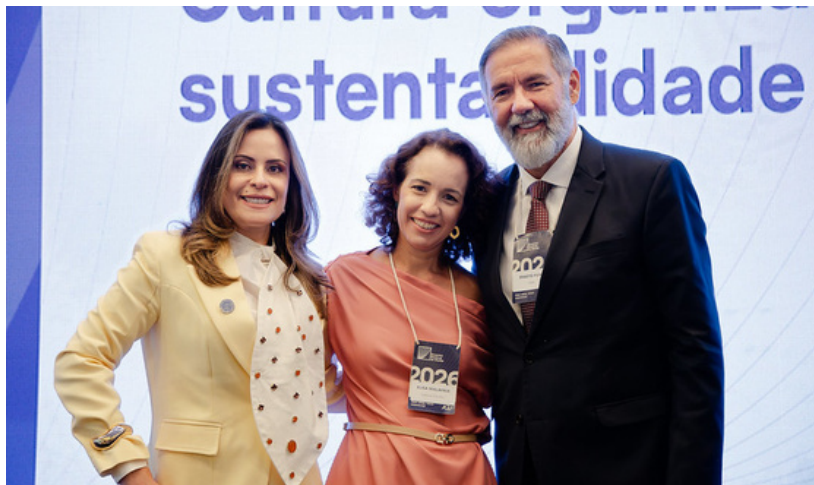
(ENCONTRO NACIONAL DE GESTÃO - PAINEL B8: CULTURA ORGANIZACIONAL, ÉTICA E SUSTENTABILIDADE)

Ética, cultura organizacional e liderança pública são debatidas em painel com participação da Comissão de Ética da AGU