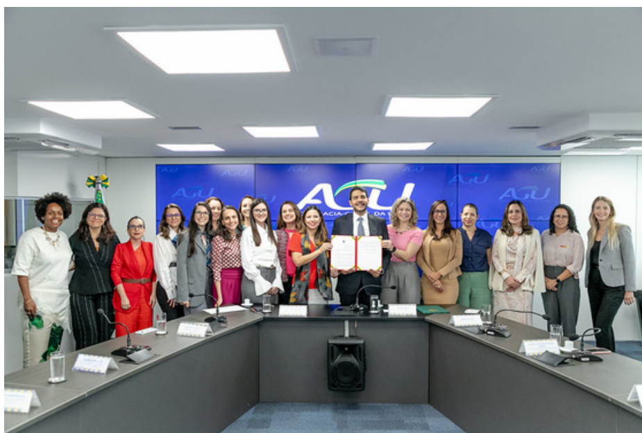
09/03/2026 - ASSINATURA DA PORTARIA DE ATUAÇÃO SOBRE A PERSPECTIVA DE GÊNERO DA SGCT/AGU.

A regulamentação adota a perspectiva de gênero na atuação processual, orientando a identificação de desigualdades estruturais, o enfrentamento de estereótipos e a prevenção de revitimização. A norma abrange casos relacionados a discriminação, violência, assédio e desigualdades no ambiente de trabalho, considerando também fatores interseccionais, e reforça o compromisso institucional com a promoção da igualdade material.