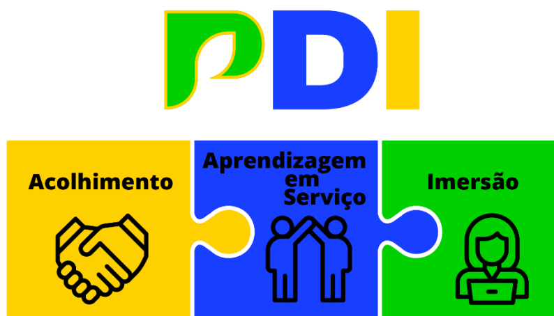
Figura 2: A Aprendizagem em Serviço está entre as primeiras formações do PDI, que se inicia após o acolhimento inicial do novo servidor. Depois dessa etapa haverá o evento de Imersão Institucional.

Essa prática oportuniza o intercâmbio cultural institucional, das consideradas boas práticas já preestabelecidas, mas também permite que o novo servidor contribua com o Mapa trazendo inovações.