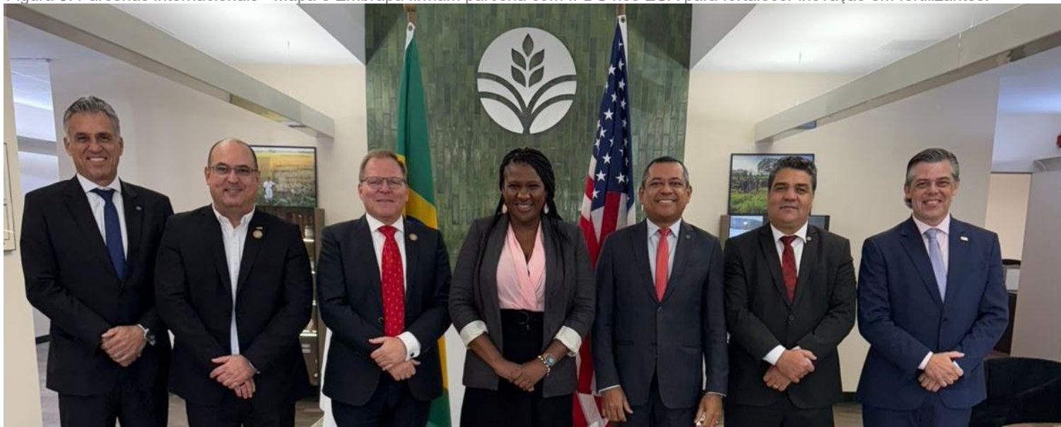
Figura 3: Parcerias internacionais - Mapa e Embrapa firmam parceria com IFDC nos EUA para fortalecer inovação em fertilizantes.

Os conteúdos devem ser contextualizados com base nas experiências dos servidores e nos desafios específicos do setor público ( Cunha; Cordeiro; Chaim, 2006 ).