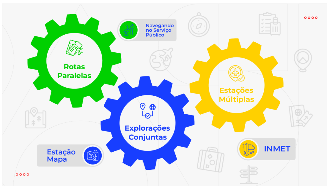
Figura 1: Mapa de Bordo da Trilha do PDI para os novos Servidores da SDI-Mapa.

Este guia tem como objetivo fornecer orientações para os servidores que atuarão como tutores durante a recepção de novos servidores públicos, oferecendo uma abordagem estruturada e alinhada às necessidades das instituições e seus participantes nos processos de recepção de novos servidores.