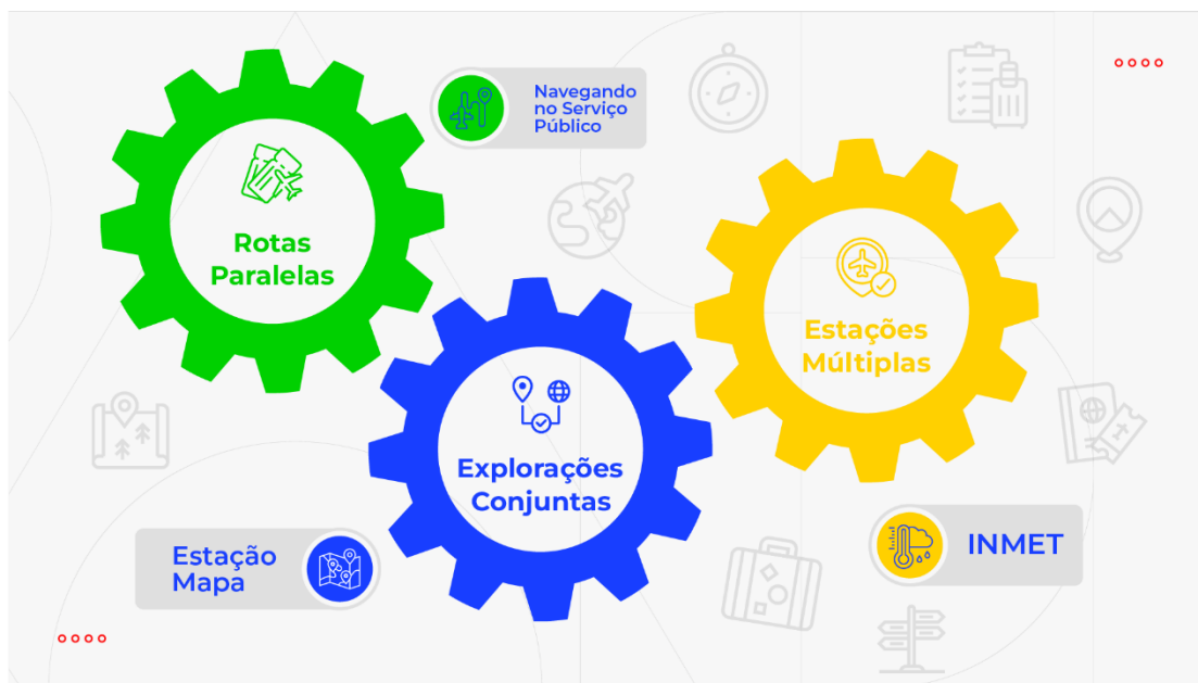
Figura 1: Mapa de Bordo da Trilha do PDI para os novos Servidores da SDI-Mapa.

Este guia tem como objetivo fornecer orientações para os novos servidores, oferecendo uma abordagem estruturada e alinhada às necessidades do Mapa.