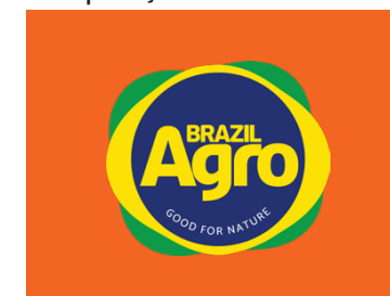
aplicação em fundo multicolorido