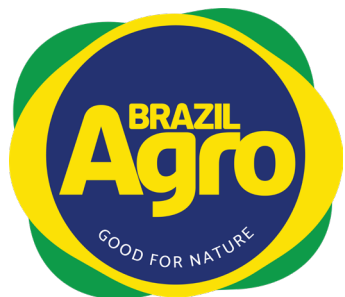
aplicação em fundo sem contraste