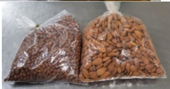
Grãos em embalagem sem identificação.