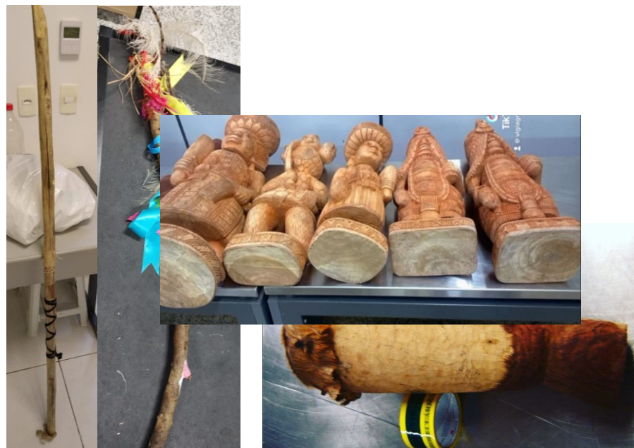
Cajados de madeira / Estátuas de madeira / Tambor com couro e madeira sem tratamento