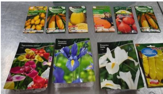
Sementes para plantio.