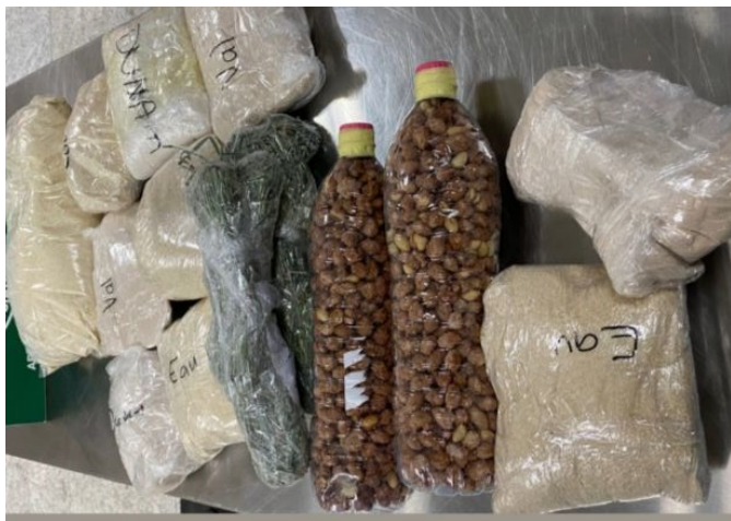
Farinhas e amendoim sem identificação

Produtos de origem VEGETAL sem identificação, sem rotulagem e/ou embalagem aberta.