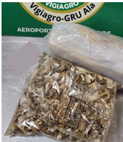
Chá sem identificação