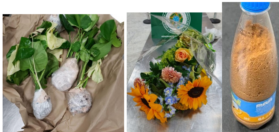
Plantas e flores frescas / Areia do deserto