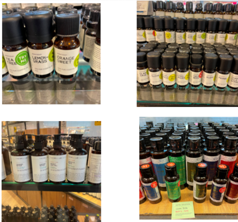
Figura 1. Produtos à base de óleos essenciais comercializados em Singapura.

Com uma indústria farmacêutica avançada, os principais setores de consumo são cosméticos e cuidados pessoais, aromaterapia e alimentos e bebidas. O setor de spa e relaxamento, que inclui cuidados pessoais, produtos de higiene e perfumes, é o que mais cresce em Singapura. Já no setor de alimentos e bebidas, o crescimento acontece por causa da maior procura por aromatizantes naturais e produtos mais “limpos”, com previsão de crescer cerca de 9,3% ao ano até 2033.