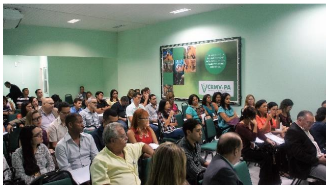
I Fórum paraense de discussão das diretrizes da OIE sobre bem estar animal bovinos, auditório do CRMV, Belém/PA.