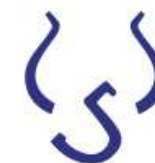
Fazenda Lagoa dos Currais Curvelo, MG