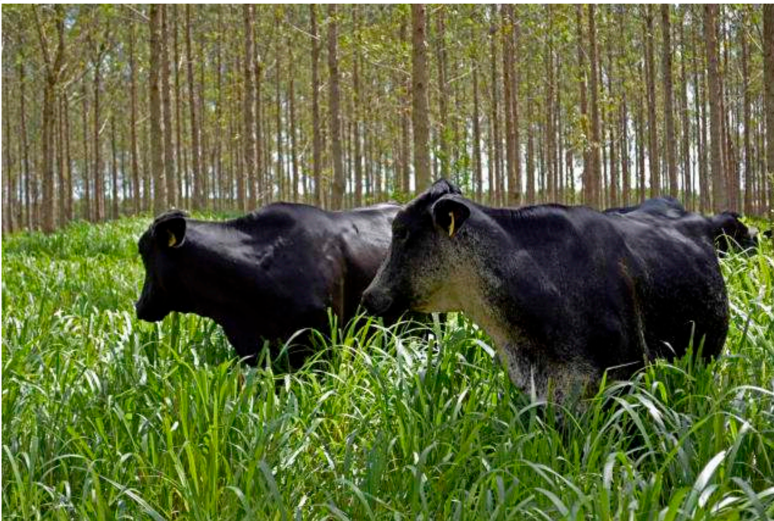
Fazenda Mogi Guaçu Paragominas, PA