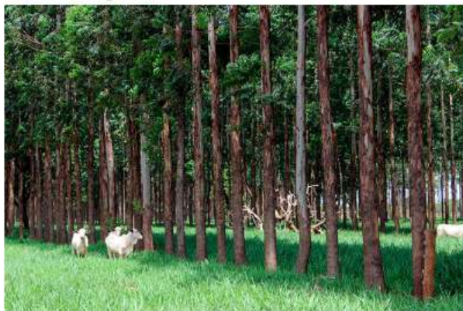
A carne carbono neutro (CCN) é produzida em sistemas integrados com a presença de árvores plantadas.

O Conceito Carne Carbono Neutro e seus posteriores benefícios, desenvolvidos pela Embrapa, motivaram a criação da Associação Brasileira de Produtores de Carne Carbono Neutro (ABCCN). A assembleia de fundação na praça São Paulo. Com a presença de produtores e especialistas, a reunião marcará também a aprovação das estatutas sociais da entidade e eleição do primeiro presidente.