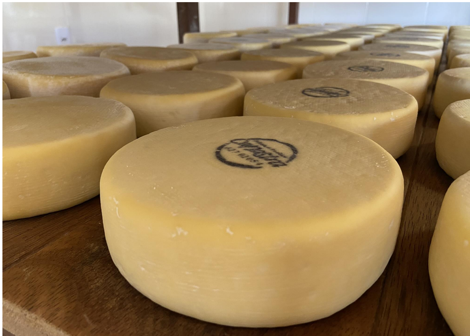
Queijo da Canastra tradicional entre 1kg e 1,2kg - R$70,00