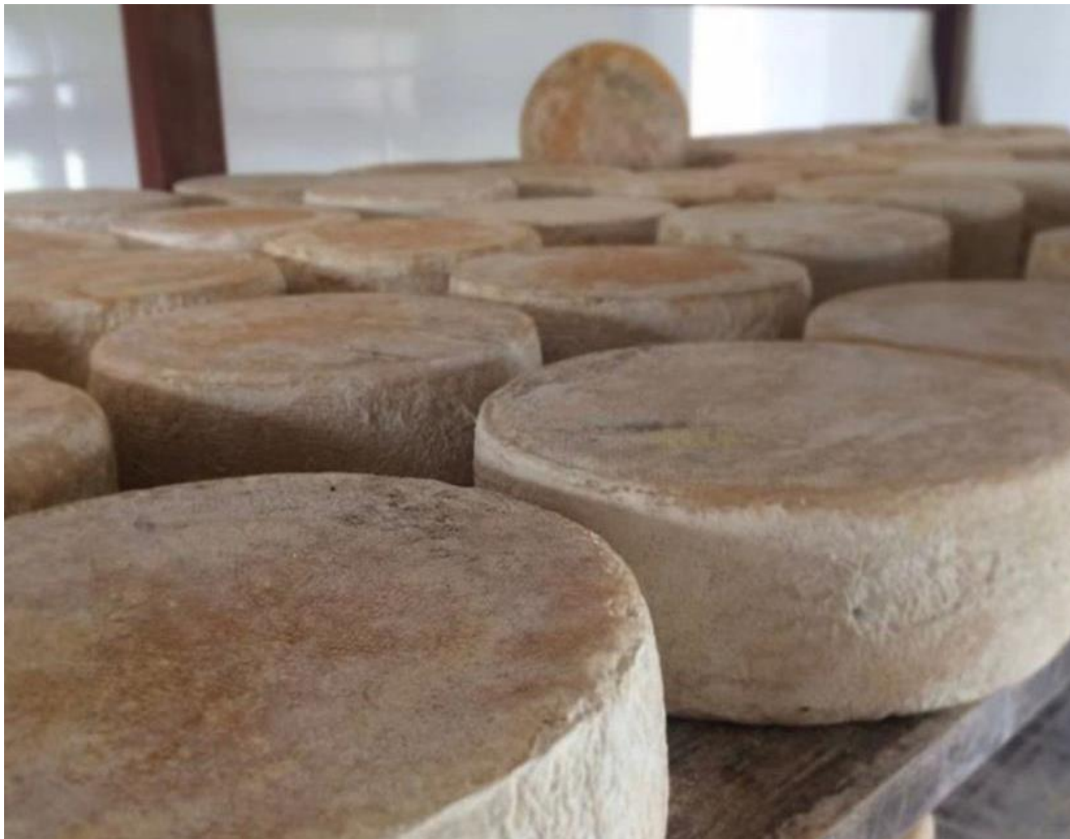
Queijo da Canastra mofo branco entre 1kg e 1,2kg - R$80,00