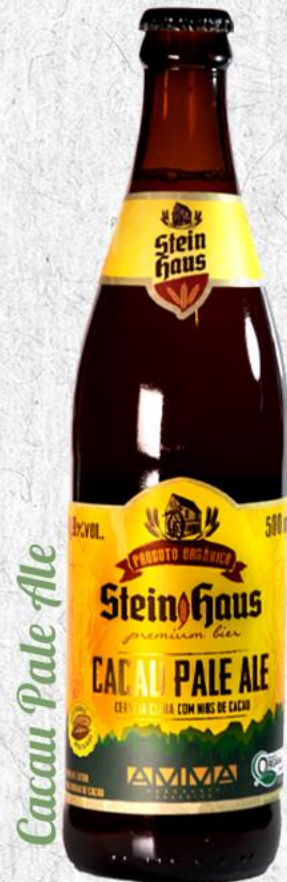
Cacau Pale Ale