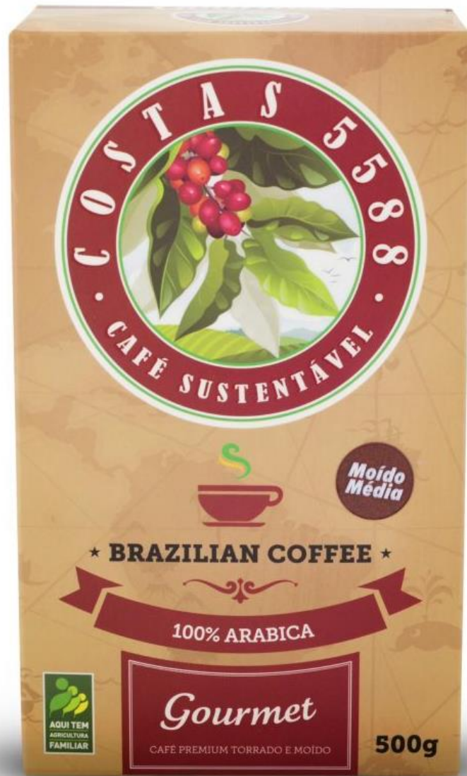
Café gourmet embalado a vácuo - torra média 500g - R$ 17,00