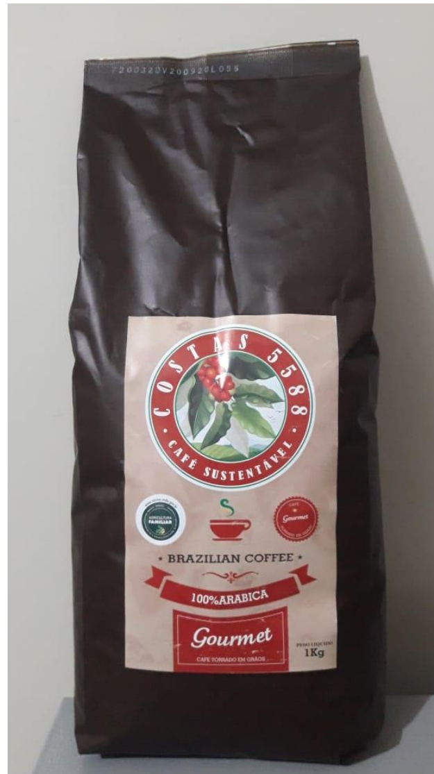
Café Gourmet torrado em grãos 1kg - R$30,00