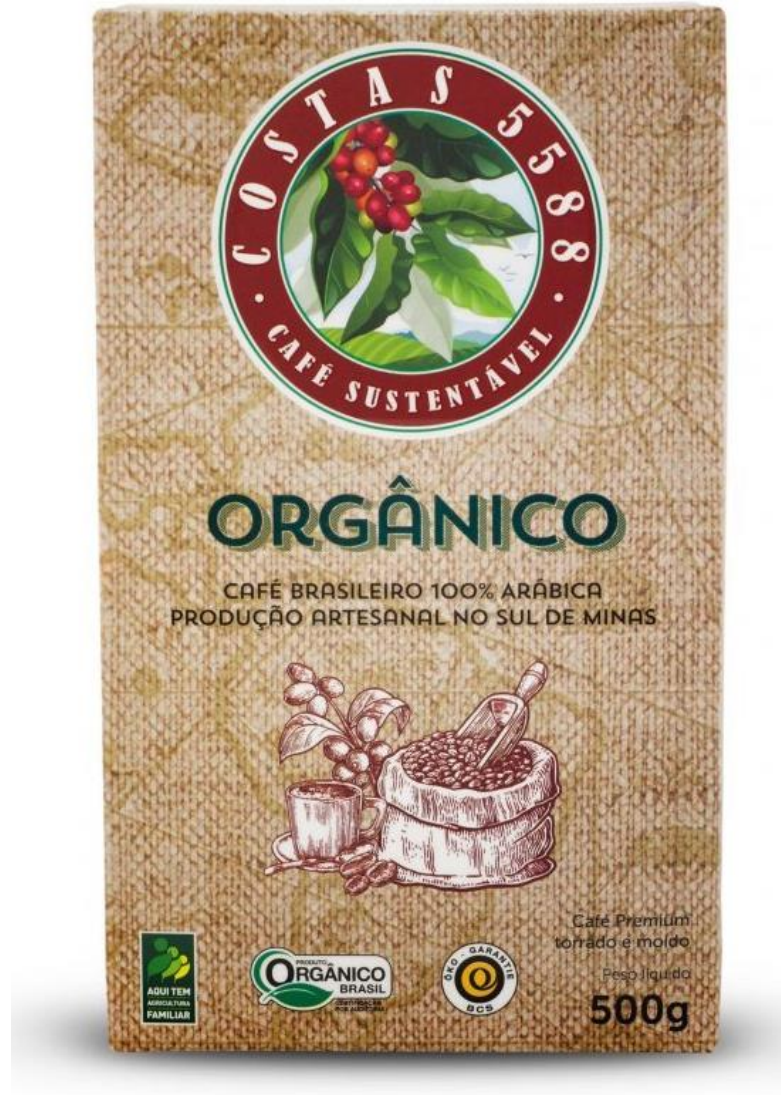
Café Orgânico embalado a vácuo 500g – R$ 28,00