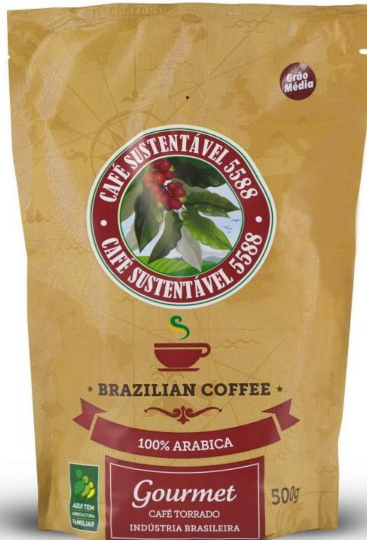
Café Gourmet em grãos, embalagem valvulada – torra média 500g – R$ 17,00