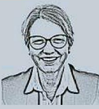
TEREZA CRISTINA CORRÊA DA COSTA DIAS, MINISTRA DA AGRICULTURA, PECUÁRIA E ABASTECIMENTO E DEPUTADA FEDERAL LICENCIADA PELO DEM-MS

A XI Cúpula do Brics, que se realiza este mês em Brasília — a terceira sediada no Brasil desde 2009 —, foi intensamente preparada pelos ministros da Agricultura dos países-membros. Atentos ao tema deste ano, "Crescimento econômico para um futuro inovador", nós nos