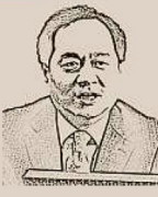
YANG WANMING, EMBAIXADOR DA CHINA NO BRASIL

A convite do presidente Jair Bolsonaro, o presidente chinês Xi Jinping virá ao Brasil entre os dias 12 e 14 de novembro para participar da Cúpula do Brics. Líderes dos cinco países vão se reunir em Brasília para debater o tema "Crescimento econômico para um futuro inovador", com o objetivo de aprofundar a parceria estratégica e a cooperação pragmática do grupo e abrir a segunda década dourada com um futuro mais promissor. O mundo de hoje vive uma transformação sem precedentes últimos cem anos. A ascensão coletiva das economias emergentes e dos países em desenvolvimento, representada pelos países do Brics, deu um forte impulso ao processo de multipolarização mundial. Depois de uma década, o Brics está