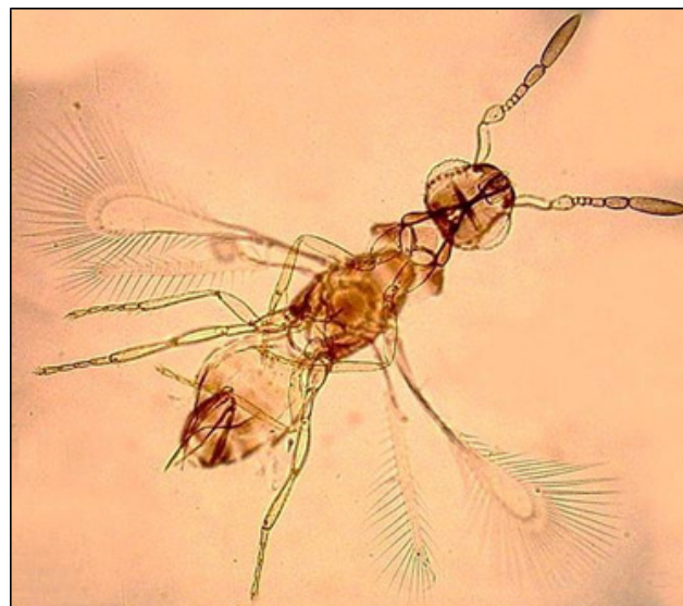
Figura 2. Fêmea adulta de Erythmelus tingitiphagus (Hymenoptera: Mymaridae).

O número médio de E. tingitiphagus , em folíolos maduros, variou de 21,7 no clone PR 255 e 2,0 no PB 217. Sempre foi verificada uma maior ocorrência do parasitoide em folíolos maduros em todos os clones, quando comparada à sua ocorrência em folíolos intermediários e novos. Isto pode ser explicado, pelo fato do número de oviposições de L. heveae ser muito superior em folíolos maduros, proporcionando uma