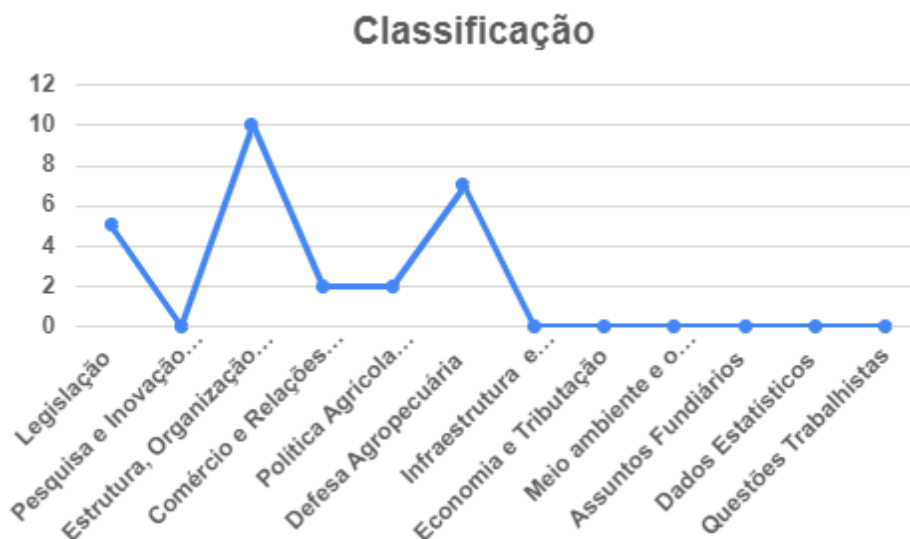
Gráfico 2: Classificação Geral dos Principais Assuntos

Por fim, é possível observar e avaliar os dados de classificação referentes aos temas abordados e os principais assuntos debatidos nas reuniões no mês de outubro. Isto é, dentre os encaminhamentos/demandas das Câmaras e os principais assuntos debatidos, houve uma similaridade no âmbito do setor mais relevante. Os dados destacaram o setor da Defesa Agropecuária; Estrutura, Organização e Fomento da Cadeia Produtiva e Legislação, com tal finalidade, e isso se dá, pela expressiva importância da temática dentro das questões que estão em evidência e que vêm sendo muito comentadas, dentro do cenário do agronegócio brasileiro atual.