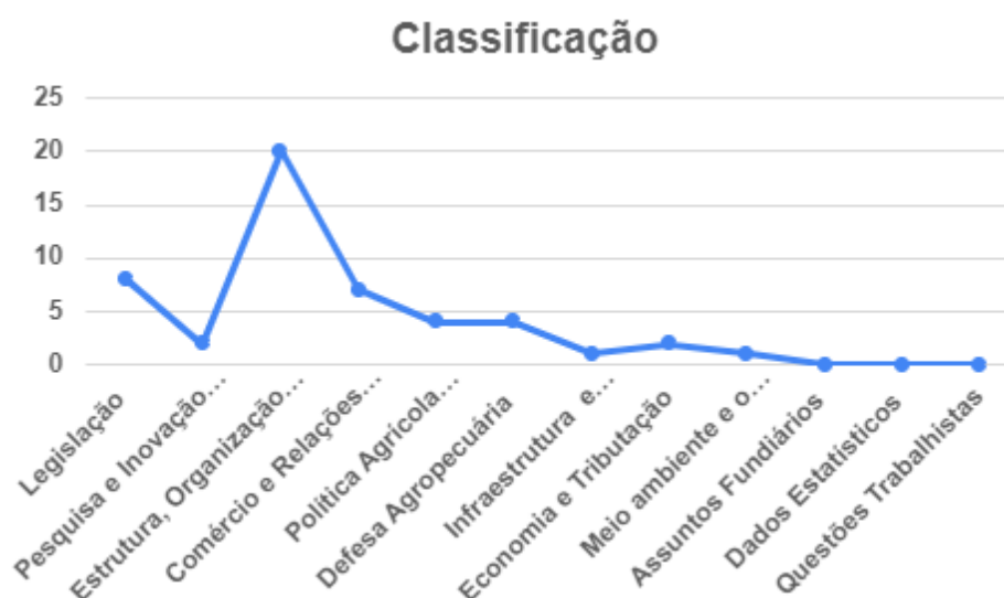
Gráfico 2: Classificação Geral dos Principais Assuntos

Com isto, é possível observar e avaliar os dados de classificação referentes aos temas abordados e os principais assuntos debatidos nas reuniões no mês de novembro. Os dados destacaram o setor da Legislação; Estrutura, Organização e Fomento da Cadeia Produtiva e Comércio e Relações Internacionais, e isso se dá, pela expressiva importância da temática dentro das questões que estão em evidência e que vêm sendo muito comentadas, dentro do cenário do agronegócio brasileiro atual.