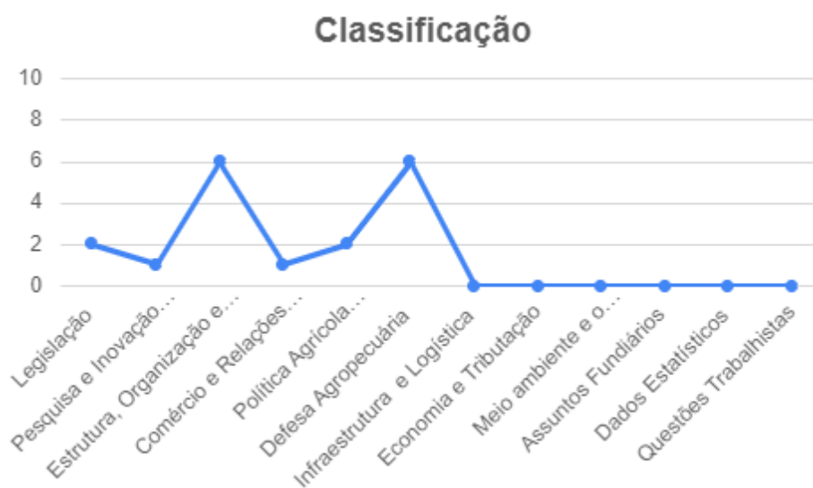
Gráfico 2: Classificação Geral dos Principais Assuntos

Por fim, é possível examinar os dados de classificação referentes aos temas abordados e os principais assuntos debatidos nas reuniões no mês de dezembro. O gráfico destaca o setor da Estrutura, Organização e Fomento da Cadeia Produtiva; Defesa Agropecuária; Política Agrícola e Legislação, e isso se dá, pela importância das questões que estão em evidência e que vêm sendo muito comentadas, dentro do cenário do agronegócio brasileiro atual.