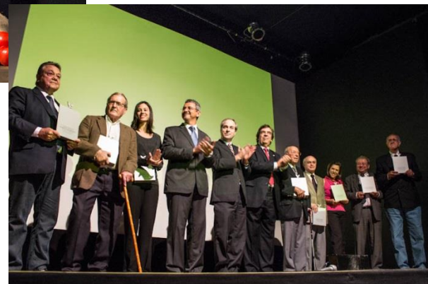
Evento com transmissão ao vivo via internet