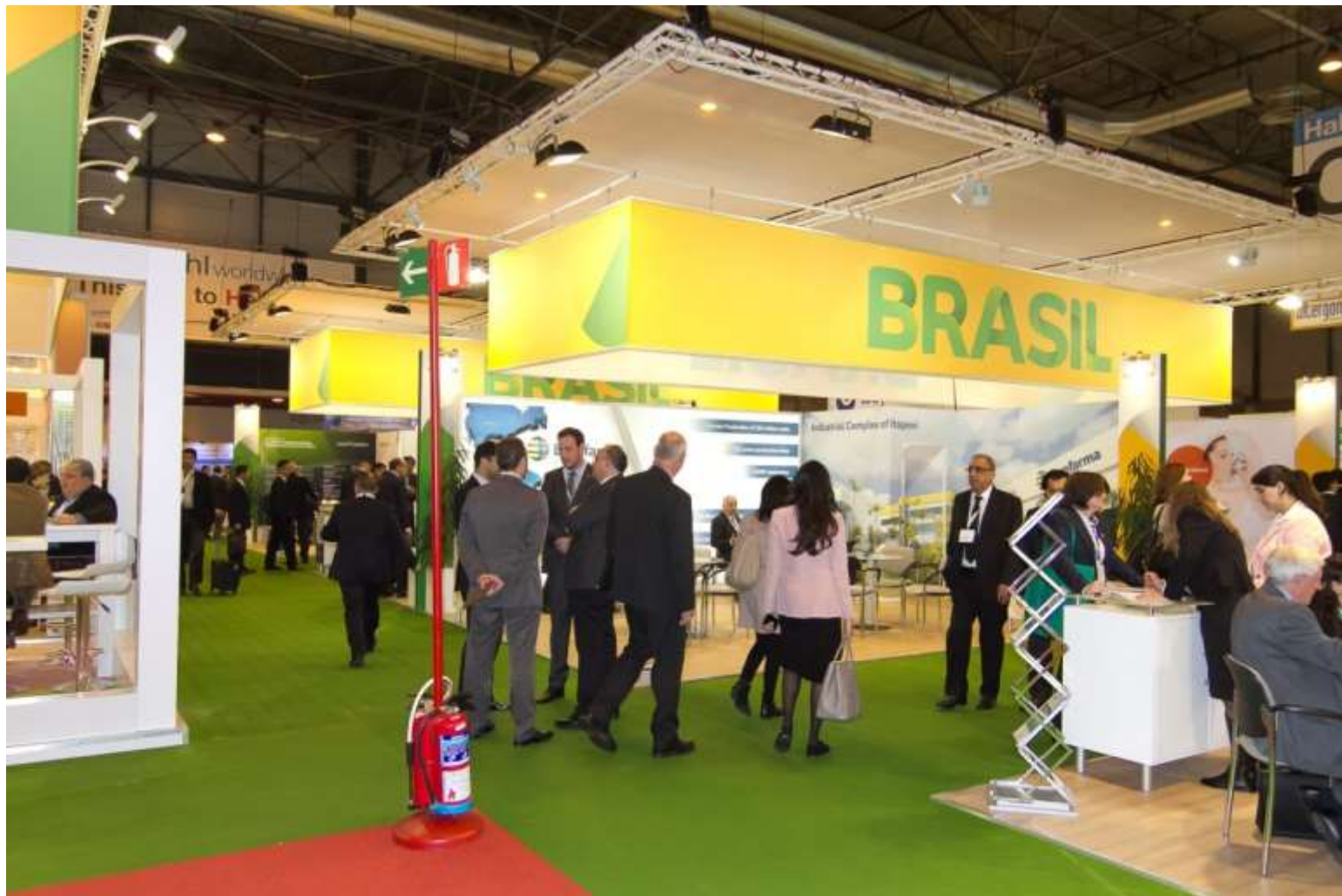
Pavilhão Brasileiro na CPhI Worldwide em Madri, Espanha – 13 a 15 de outubro de 2015