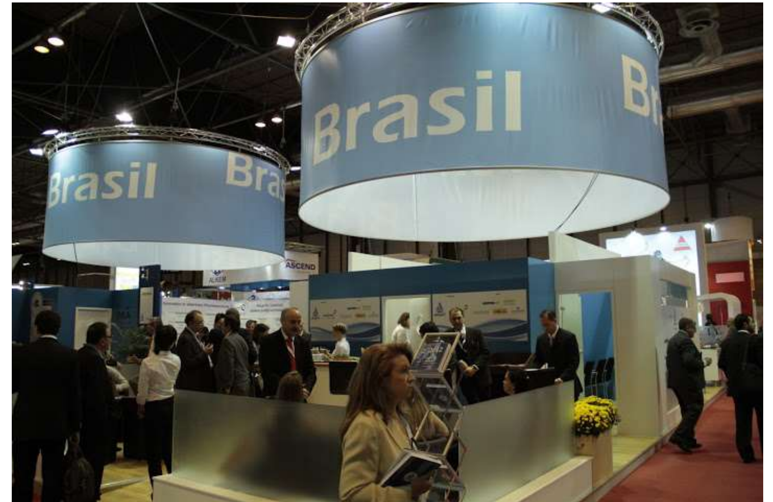
Pavilhão Brasileiro – CPhI Worldwide 2011 – 25 a 27 de outubro, Frankfurt, Alemanha Pavilhão Brasileiro – CPhI Worldwide 2012 – 8 a 11 de outubro, Madri, Espanha