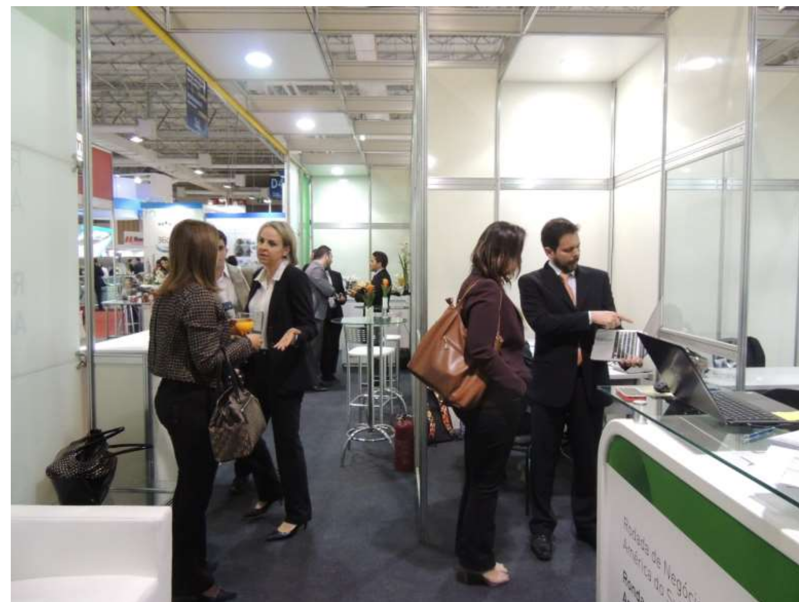
Reuniões na Rodada de Negócios FCE Farma – 12 a 14 de maio de 2015