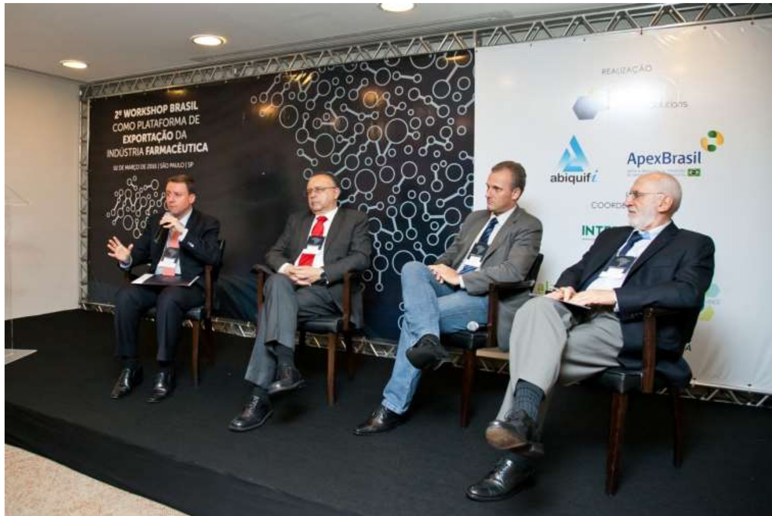
2º Workshop Brasil como Plataforma de Exportação da Indústria Farmacêutica, realizado no L'Hotel Porto Bay em São Paulo – 02 de março de 2016