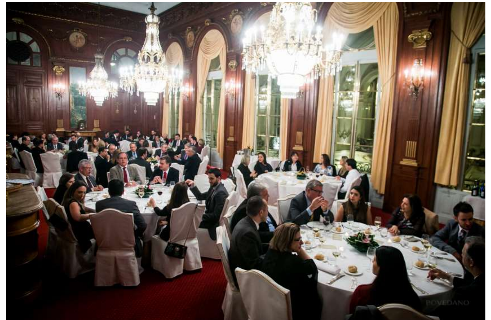
Jantar de Networking com empresários e autoridades nacionais e internacionais, realizado no Casino de Madri, durante a feira CPhI Worldwide – 14 de outubro