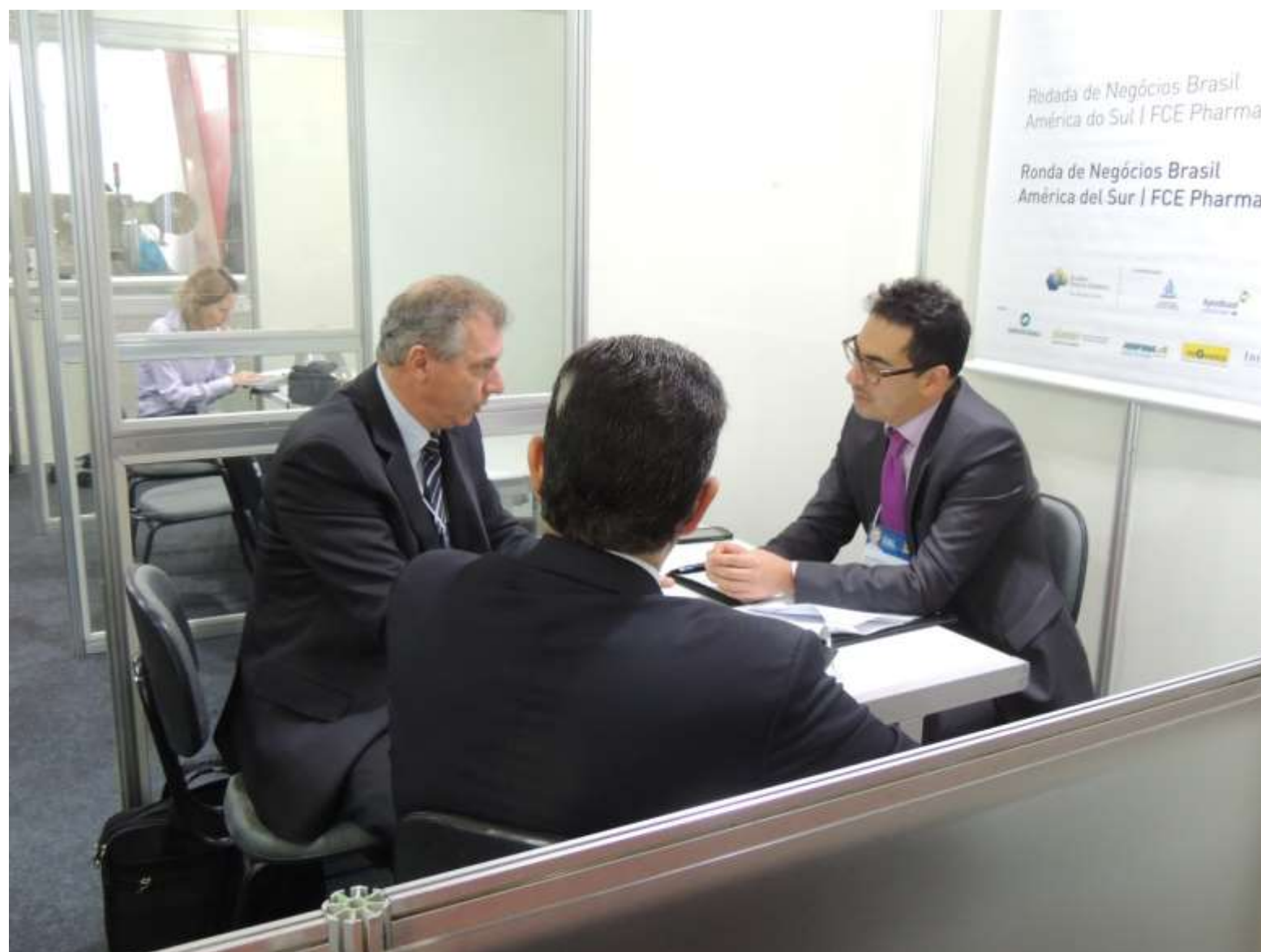
Reuniões na Rodada de Negócios FCE Farma – 12 a 14 de maio de 2015