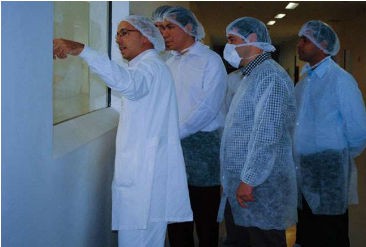
Visita das autoridades à fábrica da Farmanguinhos – 17 de junho de 2013