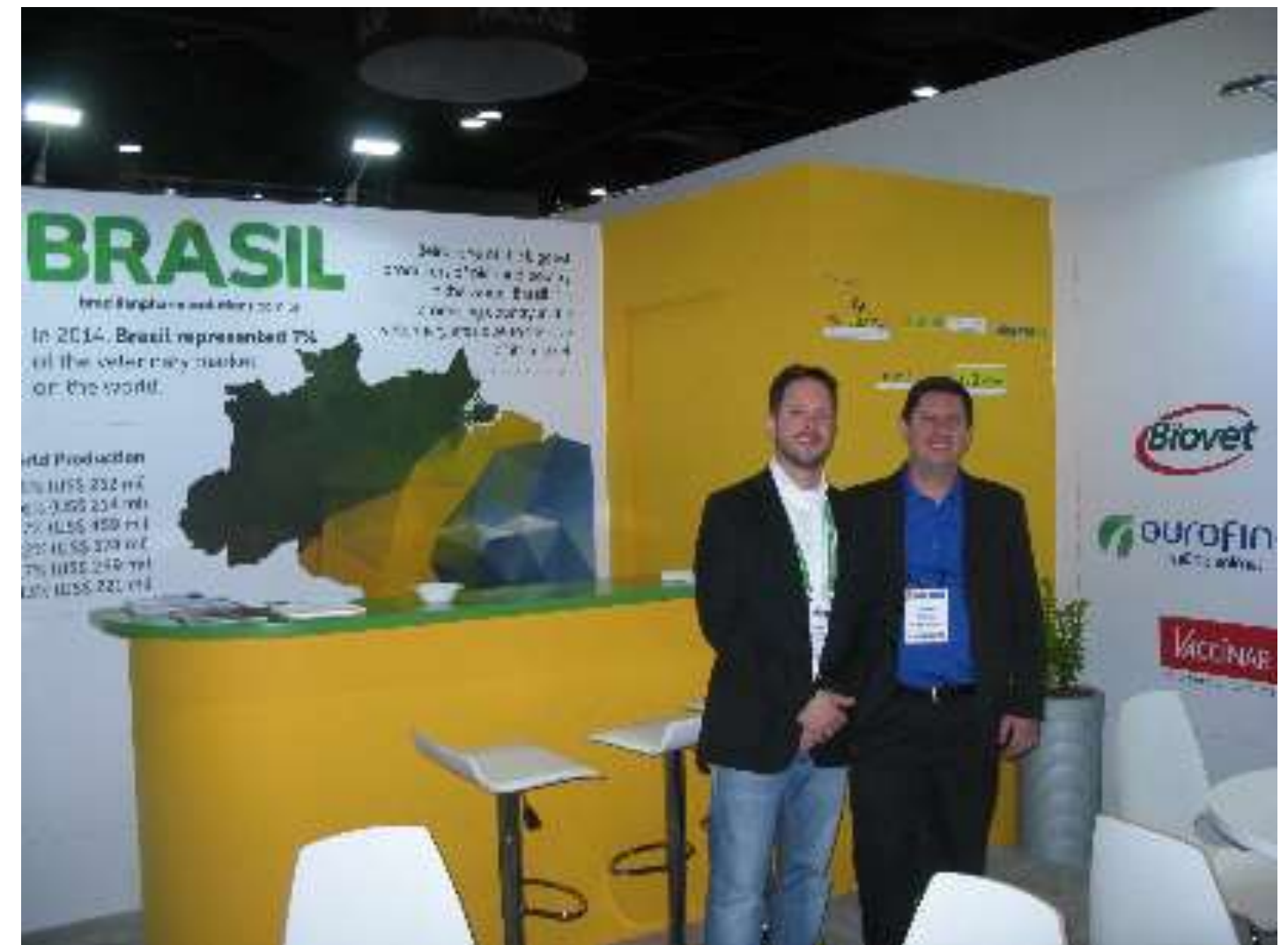
Pavilhão Brasileiro na feira IPPE – International Production & Processing 2016 – 26 a 28 de janeiro, Atlanta, Estados Unidos