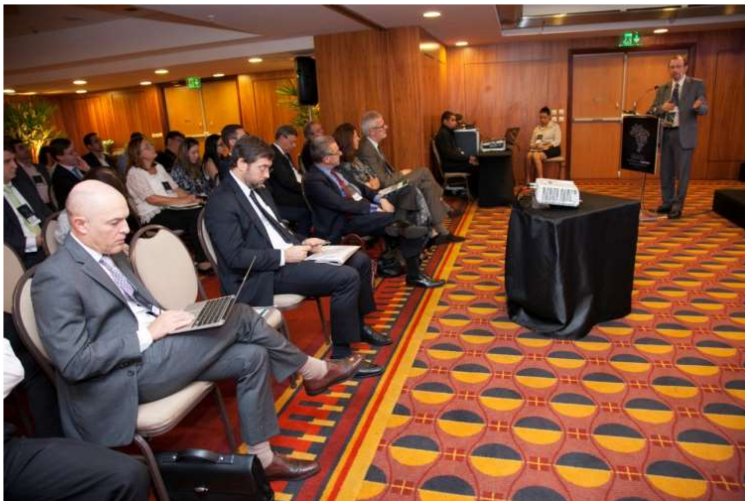
1º Workshop Brasil como Plataforma de Exportação da Indústria Farmacêutica, realizado no Hotel Renaissance em São Paulo – 03 de dezembro de 2014