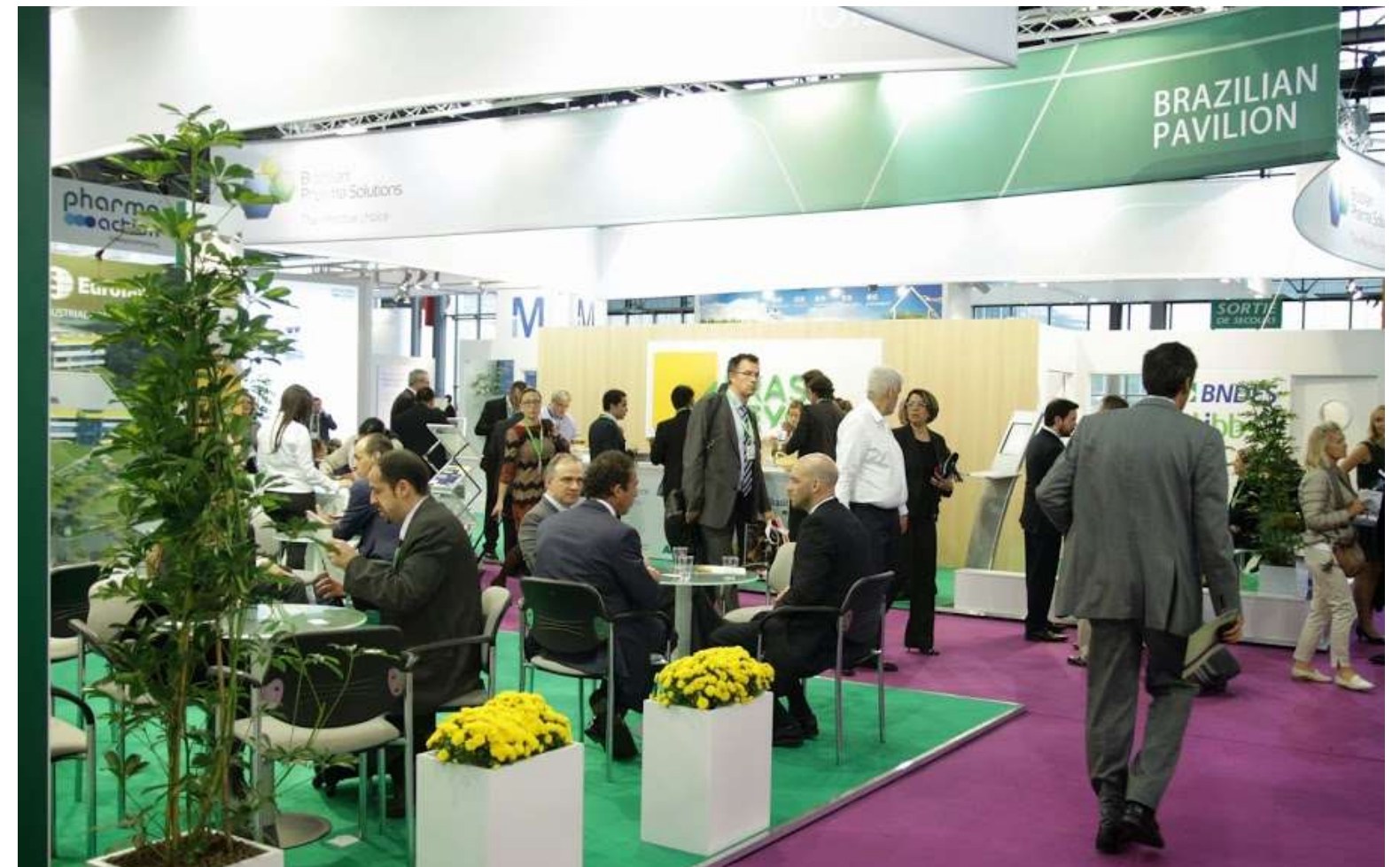
Pavilhão Brasileiro – CPhI Worldwide 2013 – 22 a 24 de outubro, Frankfurt, Alemanha