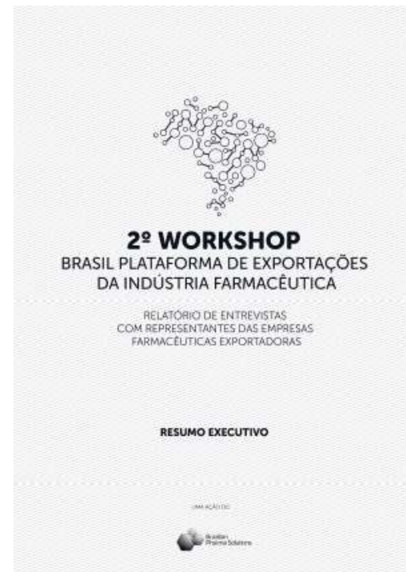
Relatório de entrevistas feitas com 10 multinacionais farmacêuticas instaladas no Brasil, que serviu de insumo para o 2º Workshop Brasil como Plataforma de Exportação – março de 2016