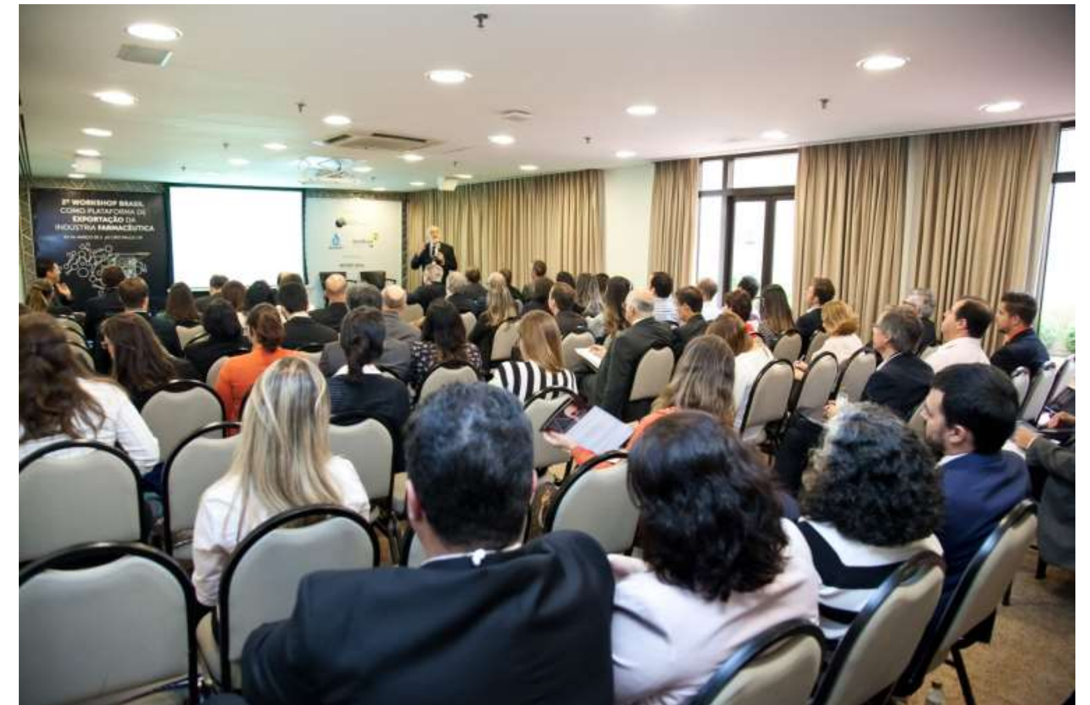
Apresentação do Prof. Jacob Frenkel no 2º Workshop Brasil como Plataforma de Exportação da Indústria Farmacêutica, realizado no L'Hotel Porto Bay em São Paulo – 02 de março de 2016