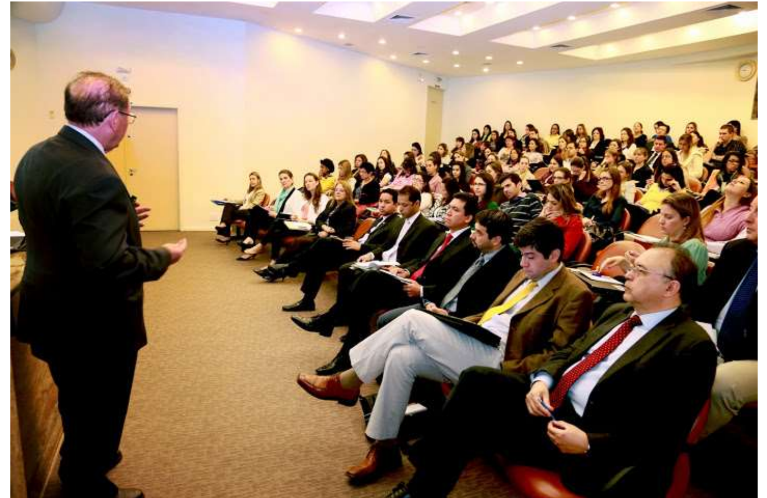
Workshop em São Paulo com autoridades do Chile e do México – 19 de junho de 2013