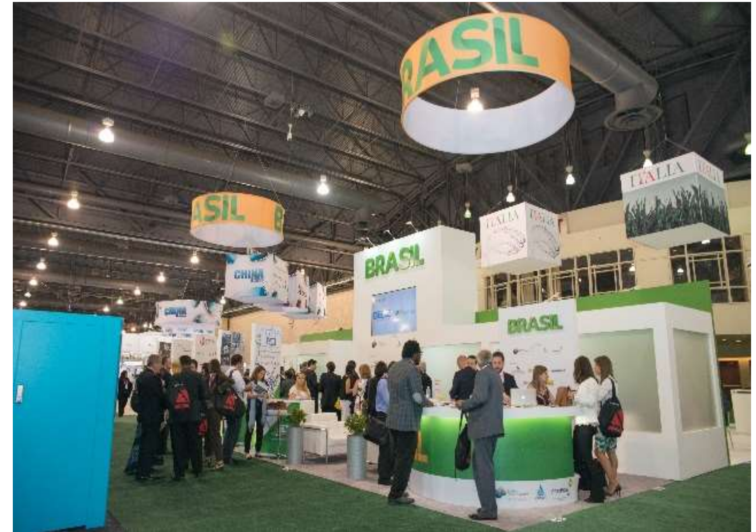
Pavilhão Brasileiro na feira BIO Convention, na Filadélfia, Estados Unidos – 15 a 18 de junho de 2015