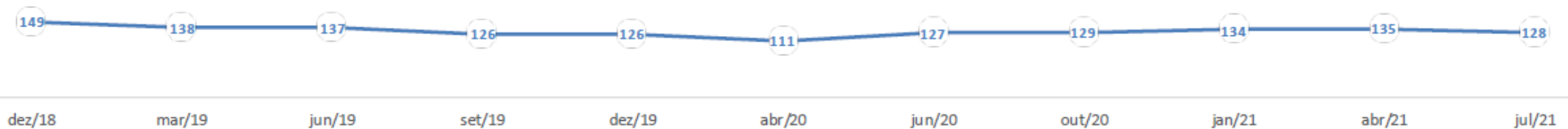
6. EXPECTATIVA DE EXPANSÃO DA AGRICULTURA NOS PRÓXIMOS 12 MESES.