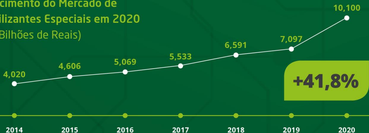
Crescimento do Mercado de Fertilizantes Especiais em 2020 (em Bilhões de Reais)

DE FERTILIZANTES ESPECIAIS, CONDICIONADORES DE SOLO DE BASE ORGÂNICA E SUBSTRATOS PARA PLANTAS EM 2020