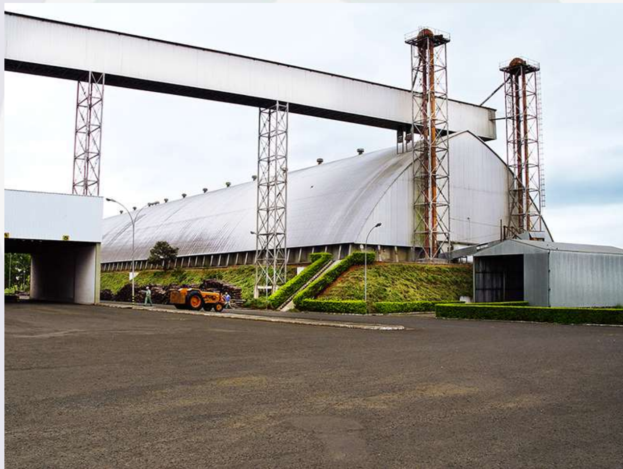
Armazém de Avaré

Presta apoio a produtores rurais, cooperativas e agroindústrias no pós-colheita de produtos agropecuários e derivados (beneficiamento, guarda e conservação de mercadorias como milho, soja, trigo, açúcar, entre outros).