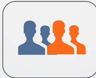
Grupos de Empresas