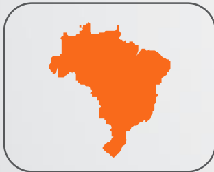
Redes de Aglomerados