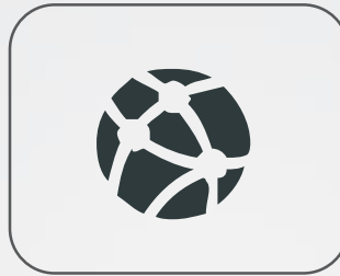
Redes de Empresas