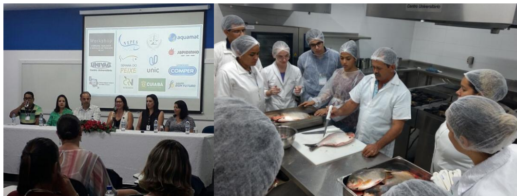
UFMT/Univag - Várzea Grande e Cuiabá (MT)