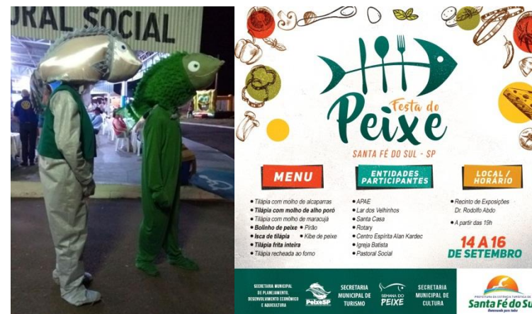
Santa Fé do Sul (SP)