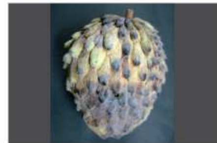
Defeito grave de casca