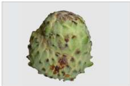
Dano mecânico grave