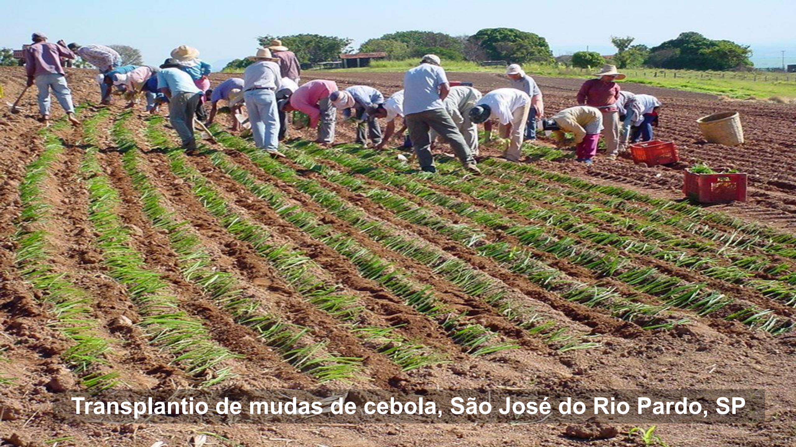
Transplante de mudas de cebola, São José do Rio Pardo, SP