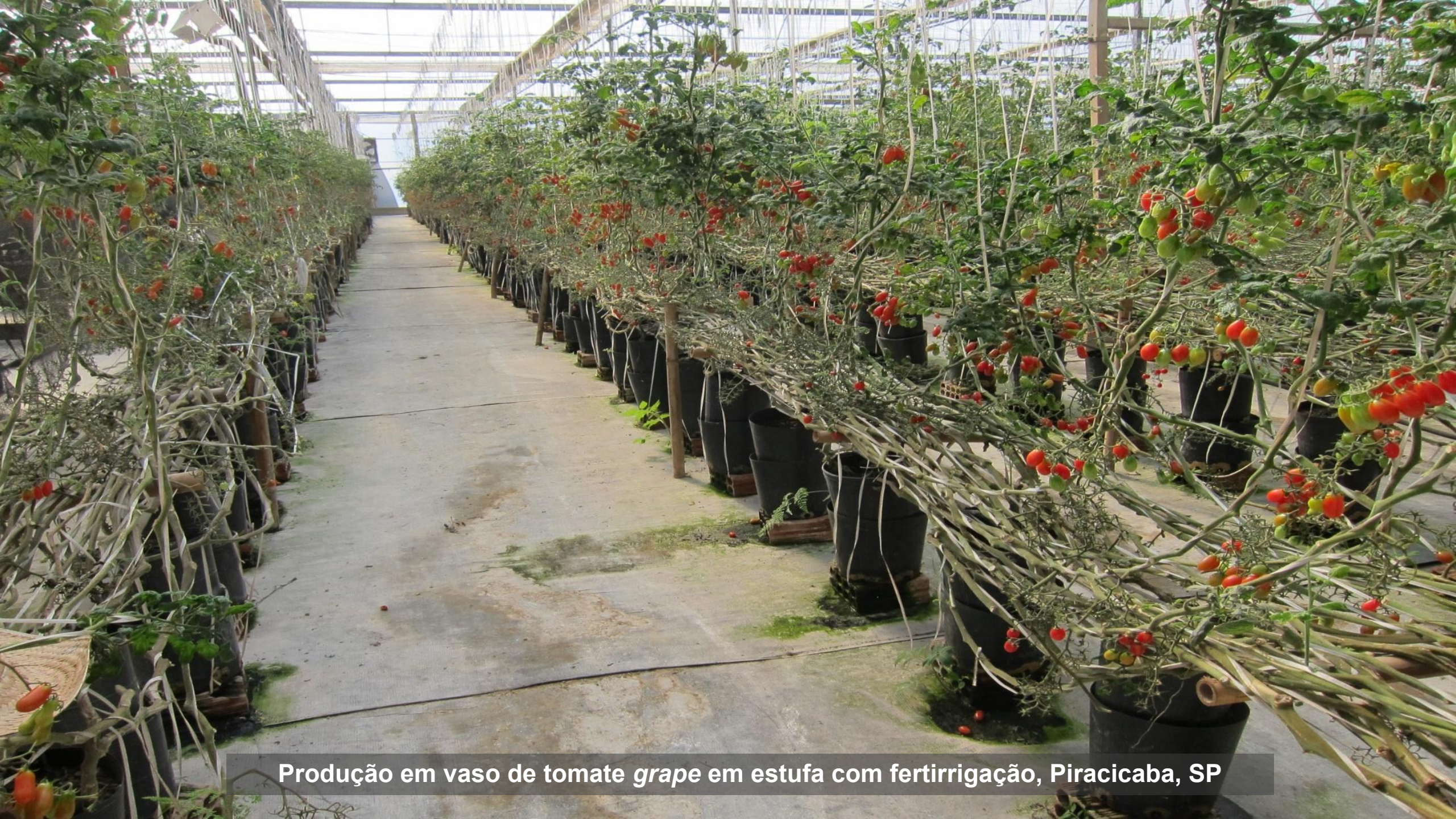
Produção em vaso de tomate grape em estufa com fertirrigação, Piracicaba, SP