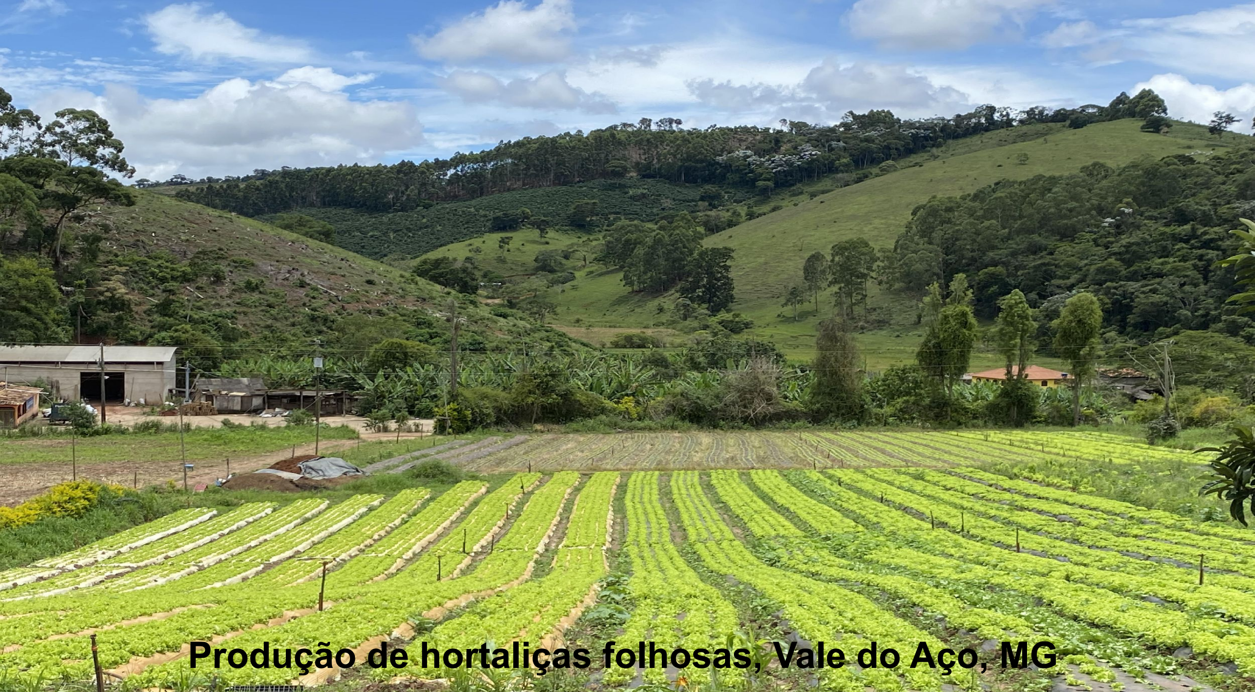
Produção de hortaliças folhosas, Vale do Aço, MG