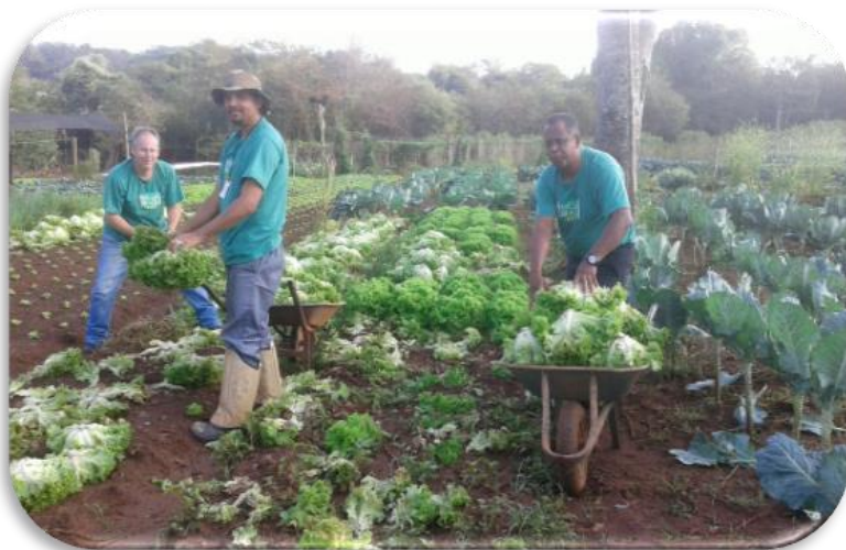
ACAMPRA: Doação de Folhosos (Uberlândia)