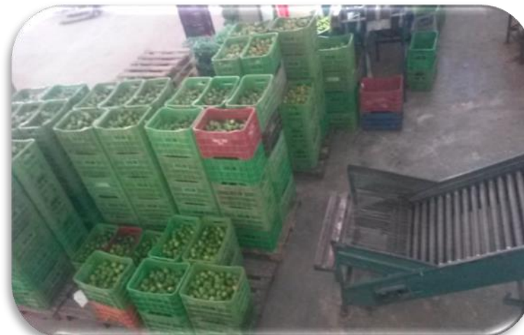
ASLIM: Doação de Limão (Jaíba)