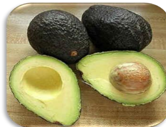
TSUGE: Doação de Abacate (São Gotardo)