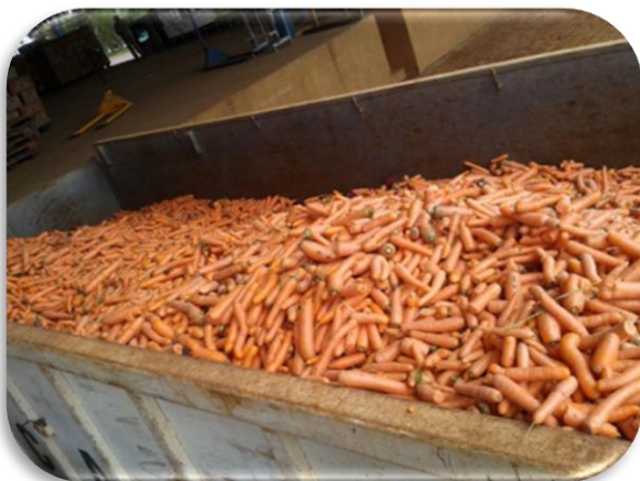
CASG e SEKITA: Doação de Cenoura e Beterraba (São Gotardo)