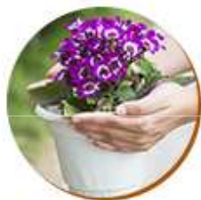
Flores em Vaso