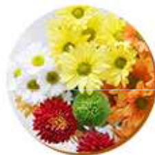
Flores em Corte