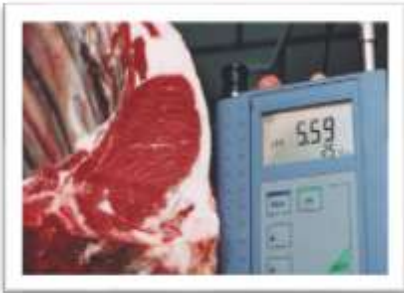
pH de carcaça