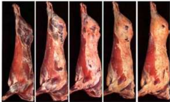
1 2 3 4 5 COBERTURA DE GORDURA