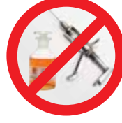
Produtos Veterinários e Agrotóxicos