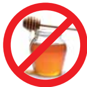
Mel e Derivados