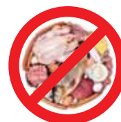
Carnes, pescados, embutidos e enlatados