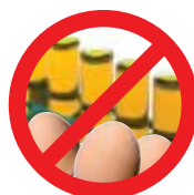
Ovos, Sêmen e Embriões