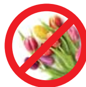
Flores e Plantas