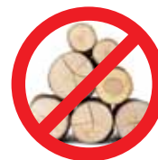
Terra ou Madeira