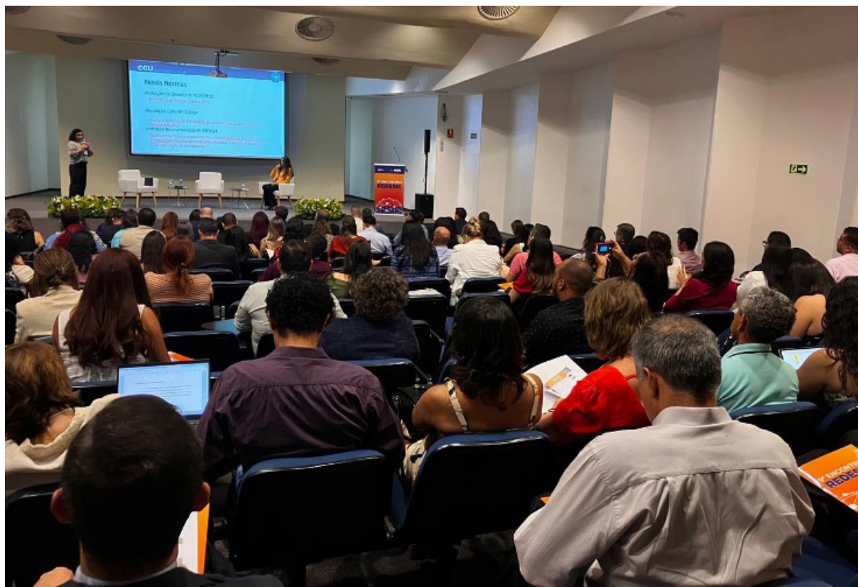
Palestra 2 – Informações Classificadas: Novas Normas e Procedimentos

mentadas para a classificação e desclassificação de informações no âmbito do Poder Executivo Federal, visando a garantir maior clareza e padronização nos processos de sigilo e transparência.