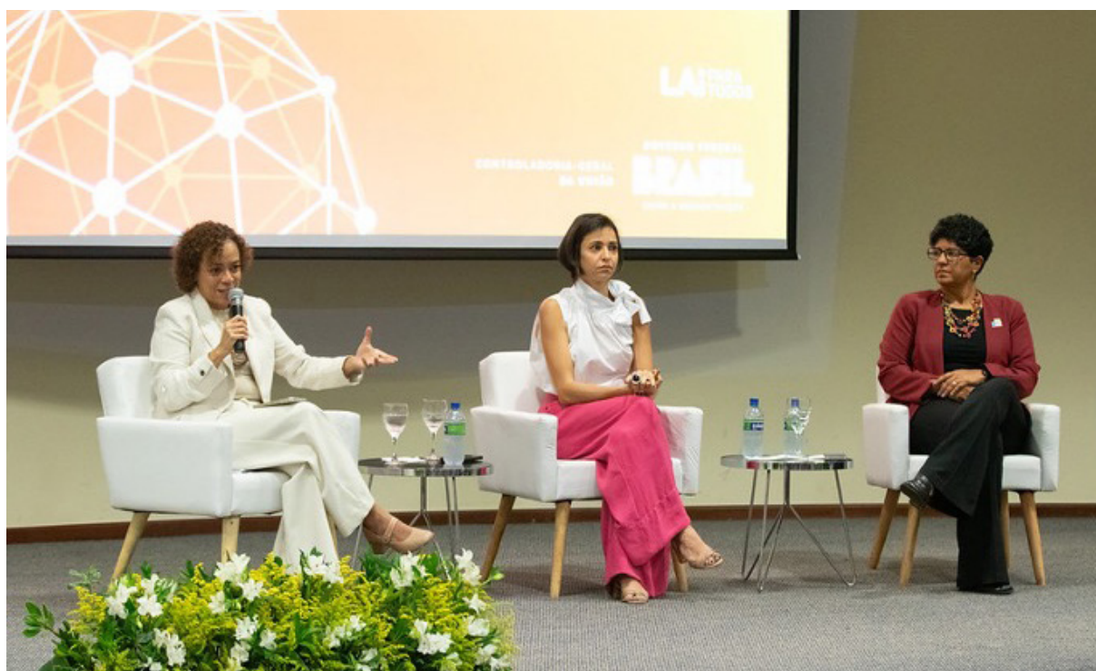
Abertura do 9º Encontro da RedeSIC

A programação do evento incluiu palestras e oficinas temáticas. As palestras abordaram temas como transparência por desenho e classificação de informações. Já as oficinas tiveram como temas: o uso da linguagem simples nas respostas aos pedidos de acesso; harmonização entre LAI e LGPD; aplicação das restrições de acesso à informação; implementação da política de dados abertos e incremento do nível de cumprimento das obrigações de transparência ativa.