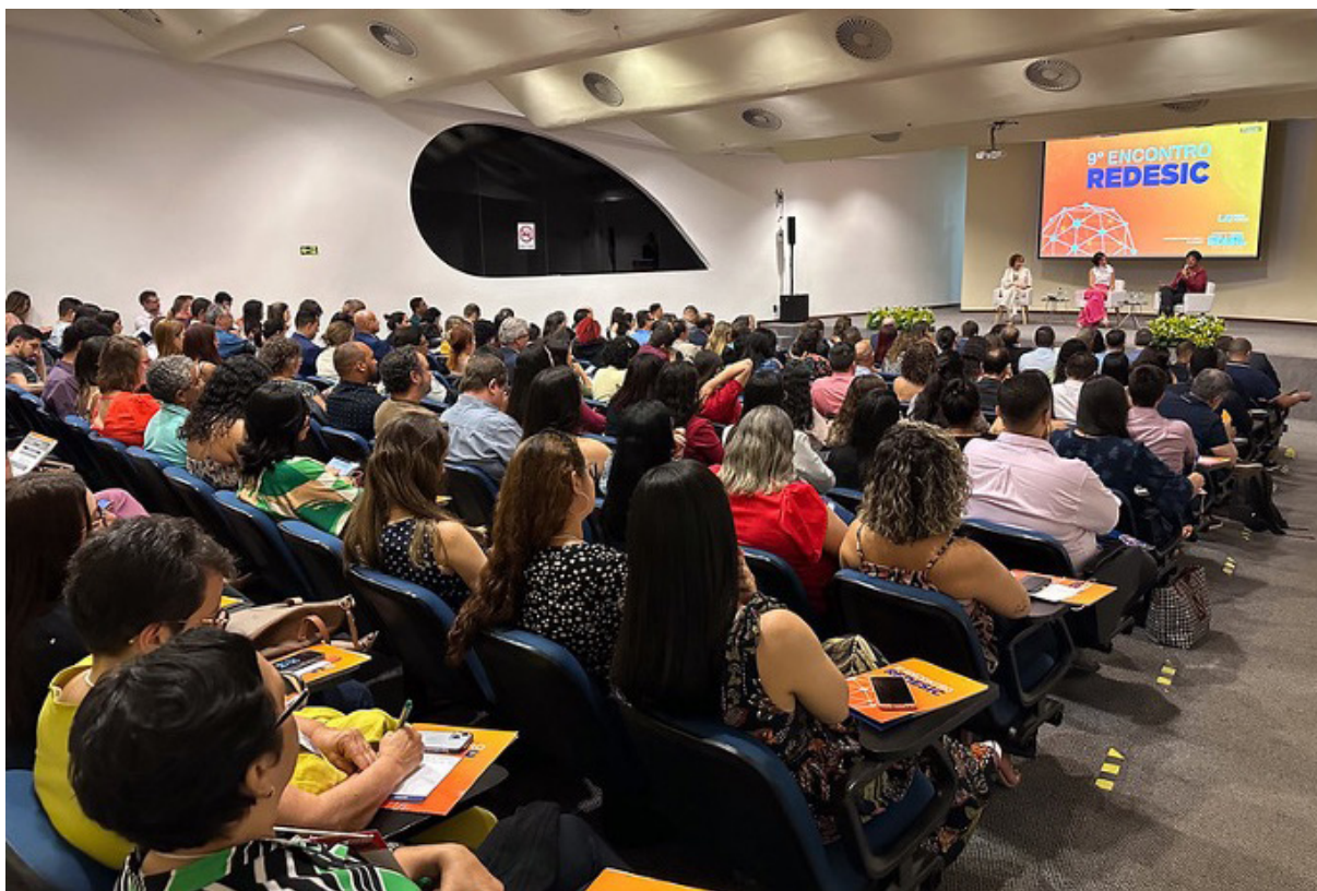
Abertura do 9º Encontro da RedeSIC