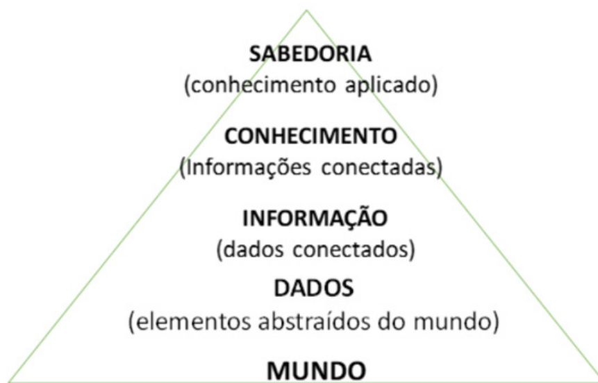
FIGURA 2 • SABEDORIA, CONHECIMENTO, INFORMAÇÃO, DADOS E REALIDADES DO MUNDO