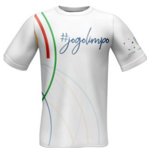
Camisa dos Agentes